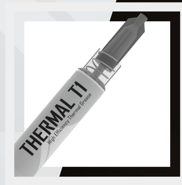
APLICADOR DE PRECISIÓN APLICA PASTA CON PRECISIÓN SIN DERRAMAR