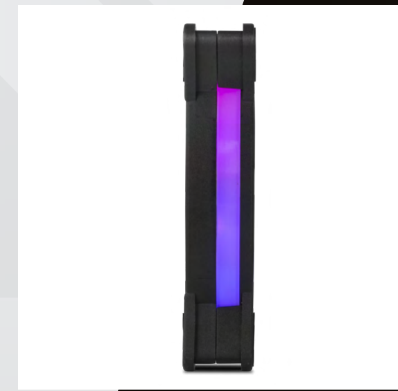
SOPORTES DE GOMA ABSORBE VIBRACIONES, MÁXIMO RENDIMIENTO Y RUIDO BAJO