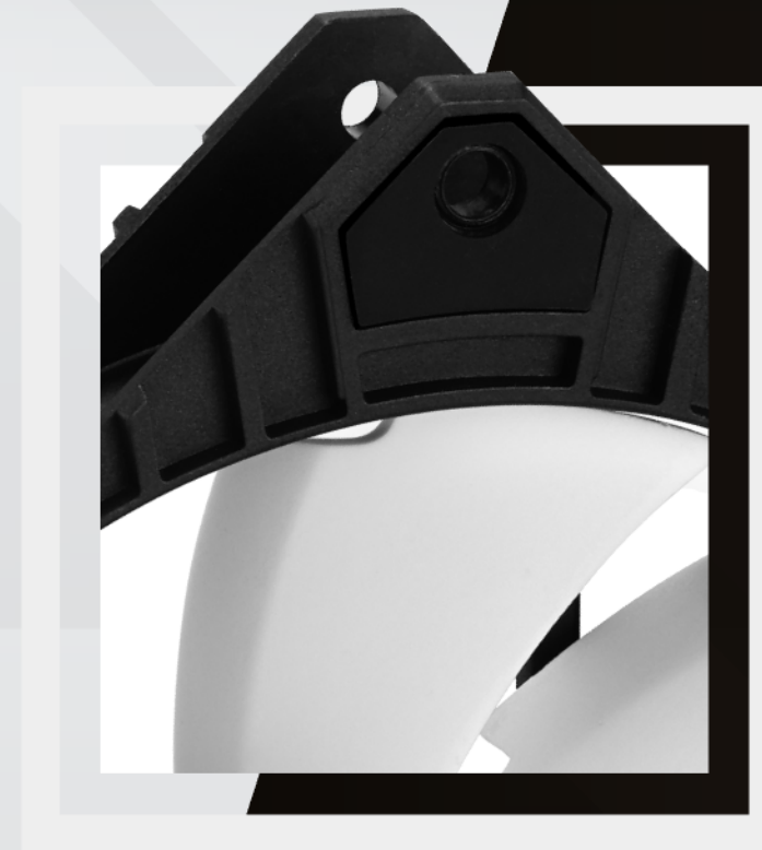
SOPORTES DE GOMA ABSORBE VIBRACIONES, MÁXIMO RENDIMIENTO Y RUIDO BAJO