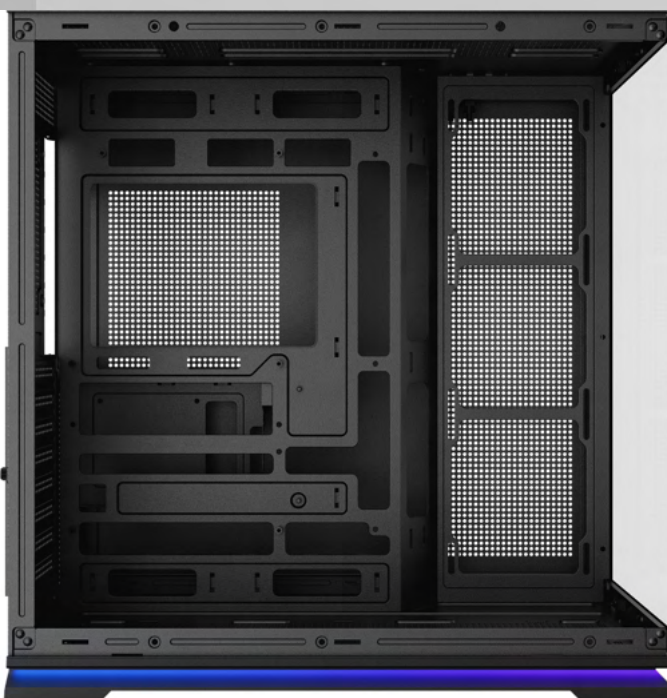
GRAN CAPACIDAD DE CIRCULACIÓN DE AIRE